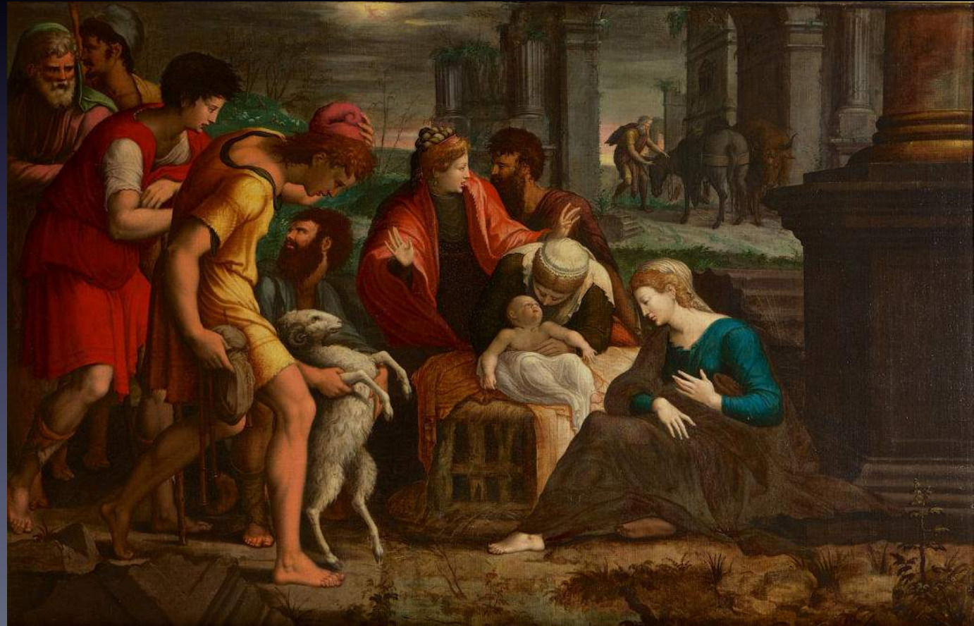
Lambert Lombard, L'adoration des bergers , Burghley Collections

Pirenne : « métis italo-flamands » de la peinture ; italianisation et théorisation