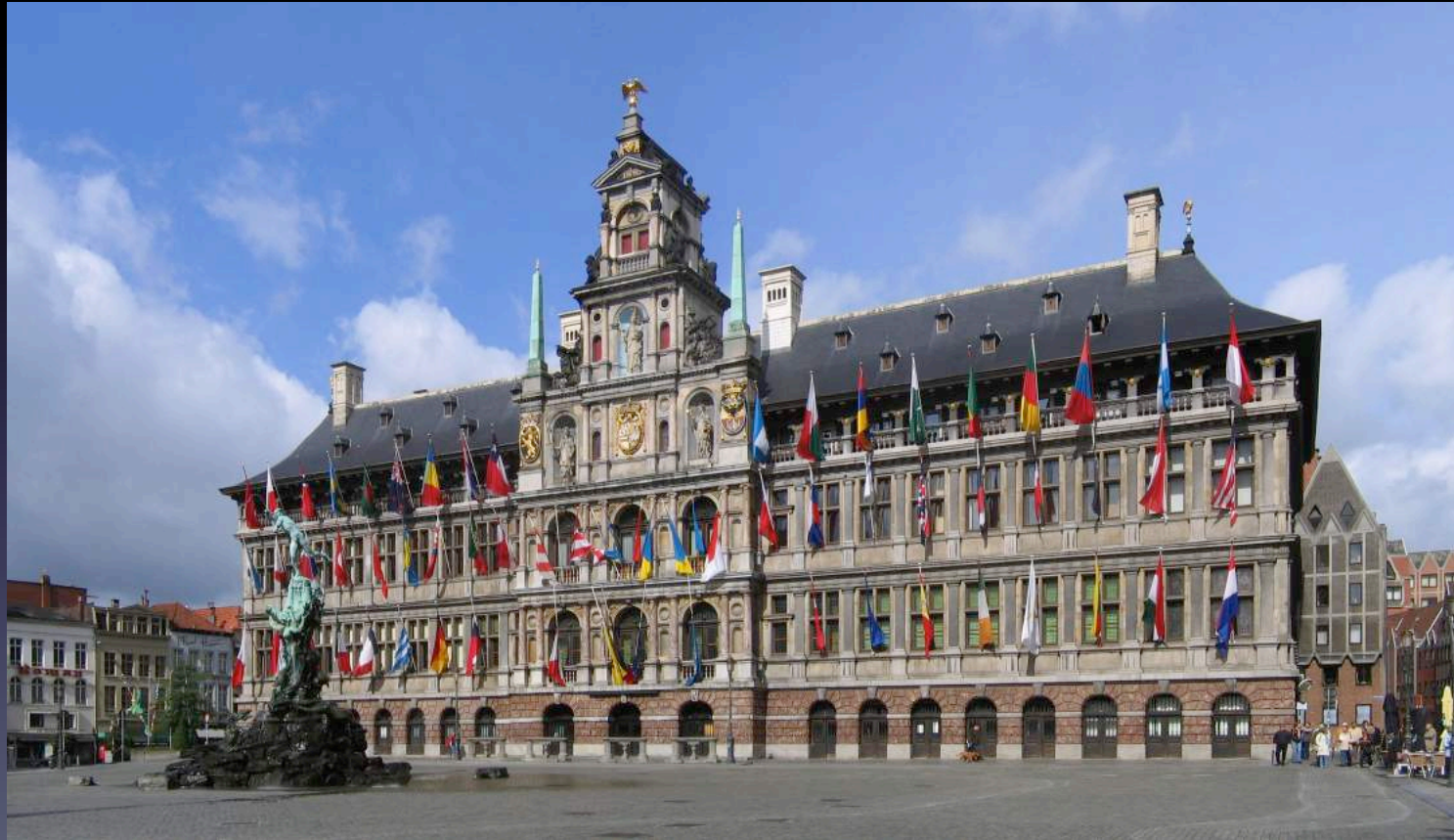
Cornelis Floris de Vriendt, Hôtel de ville d'Anvers , 1564