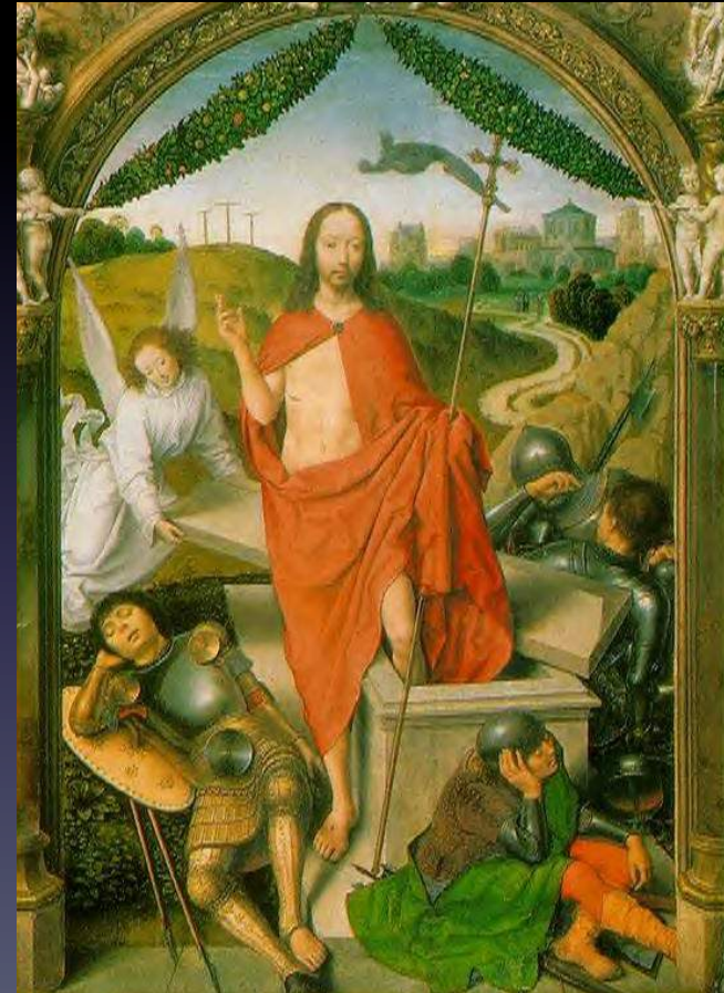
Hans Memling, Triptyque de la Résurrection (panneau central), vers 1490, Paris, Musée du Louvre