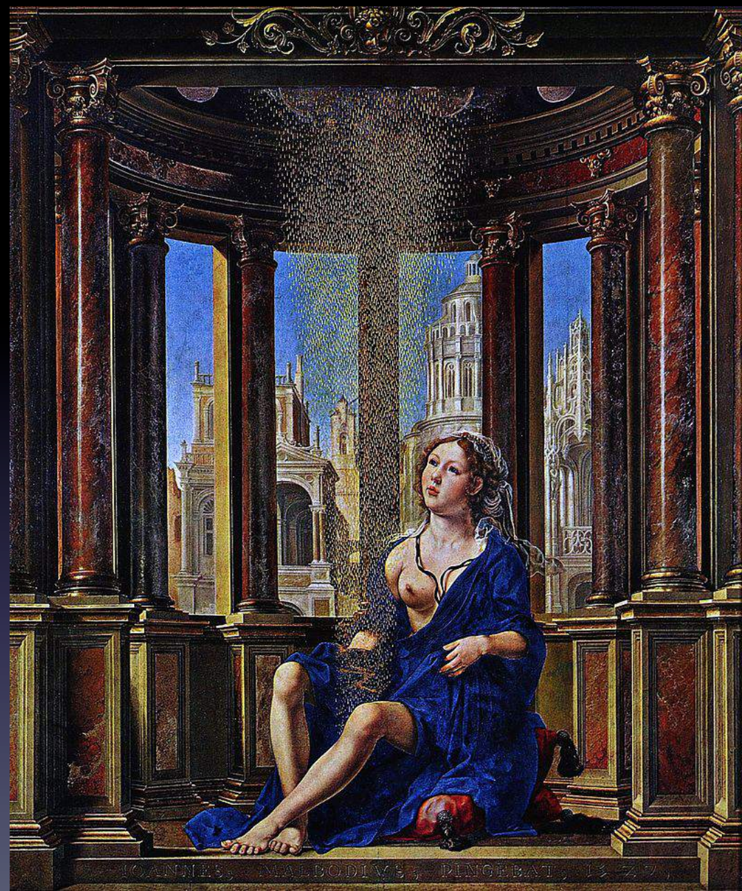
Jan Gossaert, dit Mabuse, Danaë , 1527, Munich, Alte Pinakothek