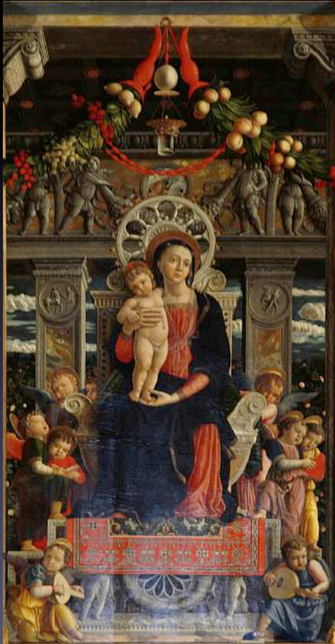
Andrea Mantegna, Retable de San Zeno (panneau central), basilique San Zeno de Vérone, vers 1457-1460