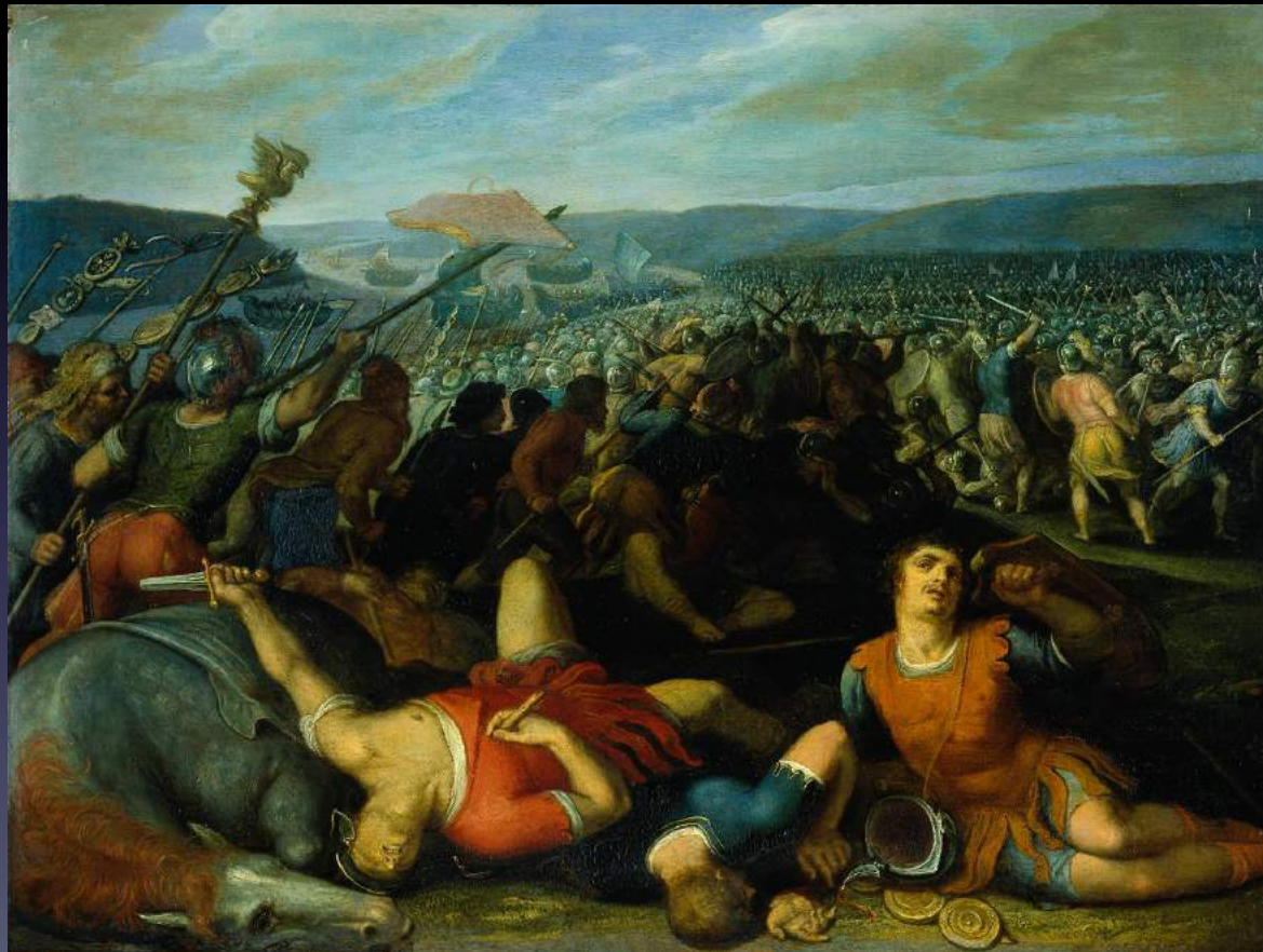
Otton Van Veen, Les Bataves battant les Romains sur le Rhin , 1600-1613, Amsterdam, Rijksmuseum