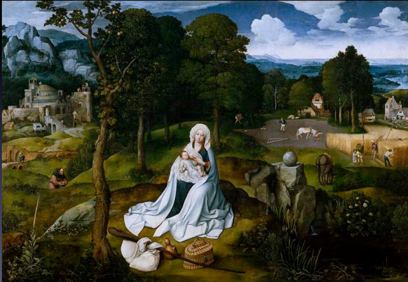
Joachim Patinier, Repos pendant la fuite en Egypte , 1518-1520, Madrid, Musée du Prado